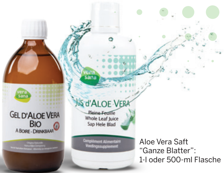
Aloe Vera Trink-Gel "Ganze Blätter": 1-l Flasche

Entdecken Sie die Vorteile von Aloe Vera Saft oder Aloe Vera trinkbares Gel. Ein Tonikum, ein lebendiges Nahrungsergänzungsmittel, reich an Aminosäuren, Vitamine und Mineralien.